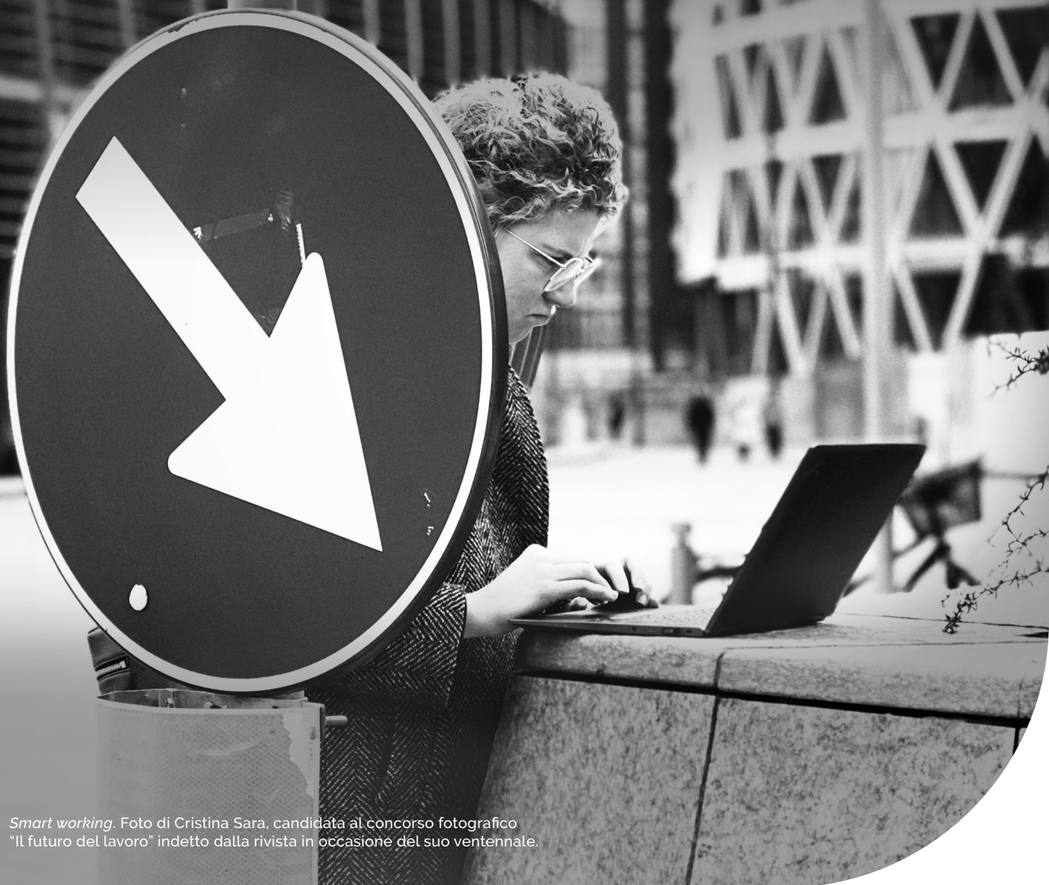
Smart working. Foto di Cristina Sara, candidata al concorso fotografico "Il futuro del lavoro" indetto dalla rivista in occasione del suo ventennale.

Da vent'anni ti raccontiamo dove va il lavoro.